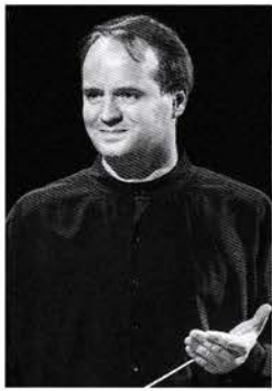
指揮者 ワシリー・ワリトフ Vasily Valitov

チャイコフスキー記念国立モスクワ音楽院オーボエ科と、オペラ・シンフォニーオーケストラ指揮科を卒業。ファト・マンソロフ(ロシア功労芸術家)やジェームズ・ジャッド(英国)などの著名な指揮者の元で研鑽を積む。2008年から2010年まで国立アストラハン市オペラ・バレエ劇場の首席指揮者となる。同時に2001年よりロシア・ユース交響楽団の音楽監督兼首席指揮者を務める。2004年から今日に至るまで、文化社会プロジェクト『青少年・心の音楽』の音楽監督をつとめ、このプロジェクトの枠の中で300以上の公演が、モスクワ音楽院大ホール、チャイコフスキーホール、国際ドム・ムジキ、クレムリン内、またはロシア正教会の総本山である救世主聖堂内のホールで毎年開催されている。海外でも高評を博し、フランスのボルドー交響楽団、ボドリヤスク市オペラ・交響楽団を2007年に、そして2012年にはマドリッド交響楽団を指揮。また、フランスではロシア・ユース交響楽団が2006年、2008年、2012年に公演を行い大成功を取め、音楽祭でグランプリを獲得。CDも2枚リリースされている。