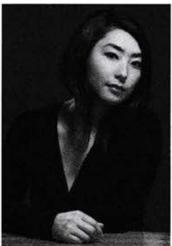
ピアノ 今仁 喜美子 Kimiko Imani

2016年よりオーストリアとロシアとの共同プロジェクト『アカデミー・ウィーン=モスクワ』の音楽監督となる。オーストリア政府等後援の元、プレゲンツ市(オーストリア)にオーストリア・ロシア夏季音楽学校を設立、音楽監督に就任。