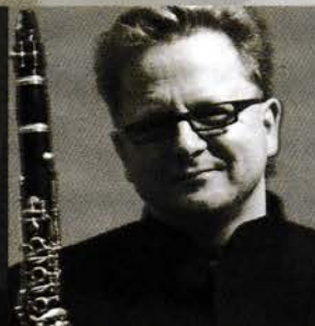
クラリネット ヴェンツェル・フックス