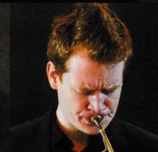
ホルン フェリックス・デルヴォー