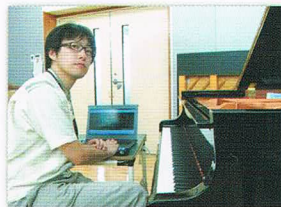
(写真) ヤマハ掛川工場にて

愛知県名古屋市出身。大学では建築音響を専攻し、2004年、京都大学工学研究科修士課程修了。ピアノ演奏歴として、1996年、第50回全日本学生音楽コンクールピアノ部門全国大会第1位、同グランプリコンサートに福岡出演。2003年、フランス・ナンシーにて夏期講習会を受講。2008年、第17回ABC新人コンサート・オーディション合格、同コンサート出演。ヤマハでは入社時よりピアノ設計に従事し、主にXAシリーズ(現在は廃番)、CFシリーズの開発、立ち上げ等に関わる。2011年からの2年間ドイツのヤマハ販売YMEに駐在し、音楽文化の奥深さや楽器の変遷などを身近に学ぶ機会を得た。現在、ヤマハ株式会社に勤務。所属はアコースティック開発統括部技術開発部FPG。磐田市在住。